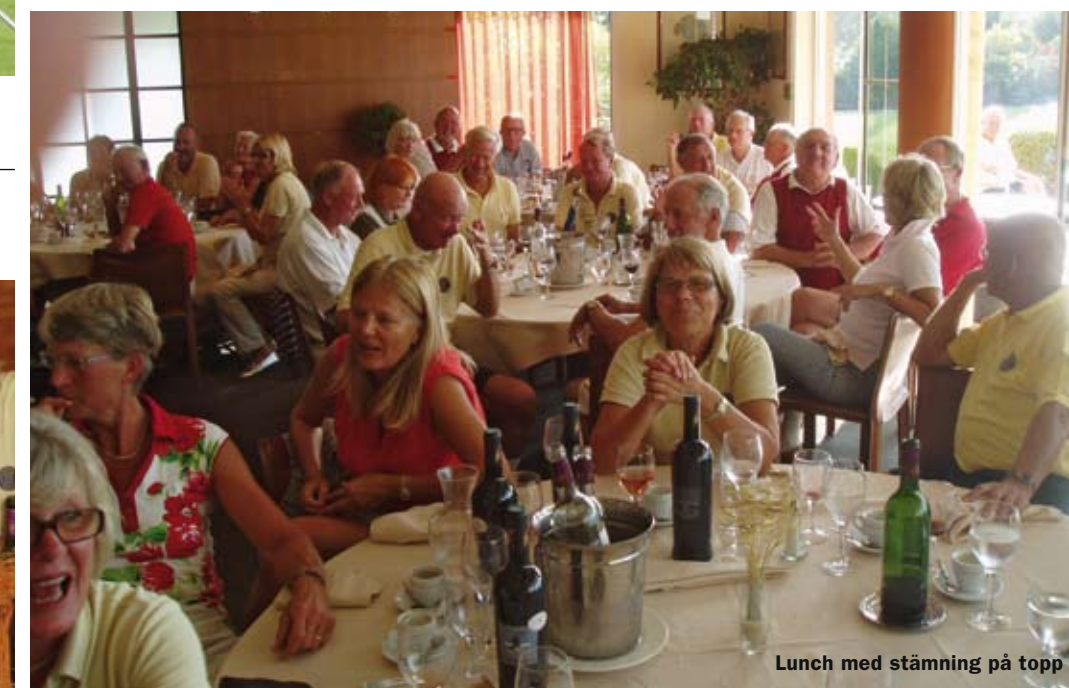
Lunch med stämning på topp